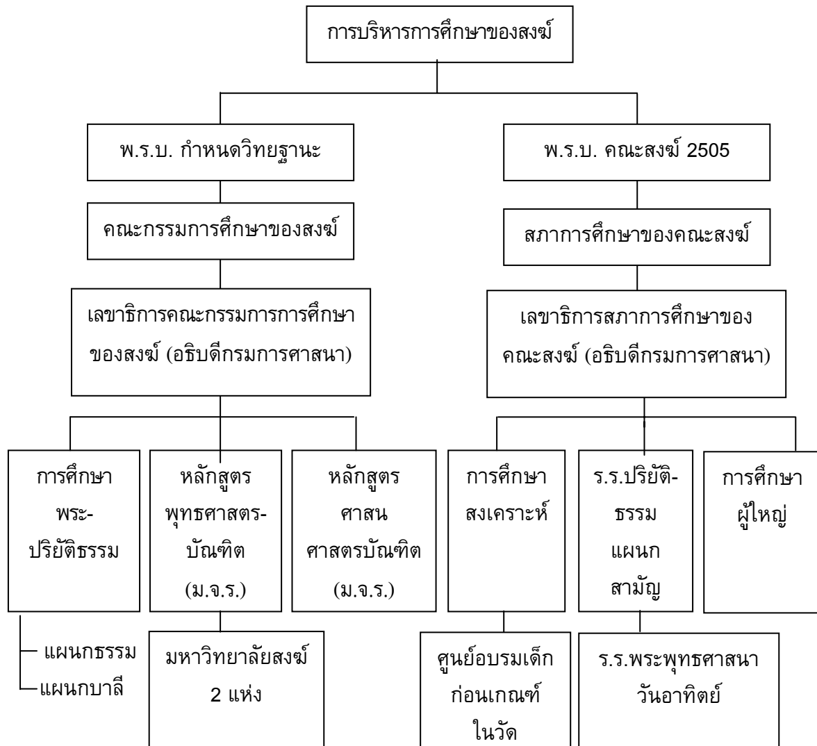
ภาพประกอบ 1 การบริหารการศึกษาของสงฆ์