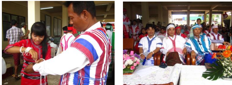
ภาพที่ 1 พิธีกรรมวันปีใหม่ของชาวกะเหรี่ยง ที่มา : ถ่ายโดยผู้วิจัยเมื่อวันที่ 25 ตุลาคม 2555

ชุมชนกะเหรี่ยงซึ่งเป็นชนกลุ่มน้อยในประเทศไทยอาศัยอยู่ในพื้นที่แม่สอด และเป็นแรงงานข้ามชาติ เมื่อถึงวันปีใหม่จะเดินทางข้ามแดนกลับไปยังเมืองเมียวดีที่พม่า เพื่อร่วมกิจกรรมวันปีใหม่ มีการผูกข้อมือ (ภาพที่ 1)