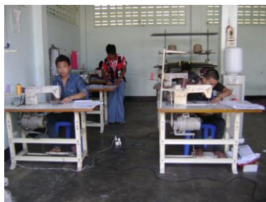
ภาพที่ 2 การฝึกทักษะการเย็บจักรให้แรงงานข้ามชาติของยองจิว

ยองจิวเป็นหน่วยงานหนึ่งก่อตั้งโดยนักศึกษาชาวพม่า ที่ให้ความช่วยเหลือแรงงานข้ามชาติชาวพม่า เมื่อเดินทางข้ามแดนมาไม่มีที่พักจึงจะให้พักใน safe house และฝึกทักษะการเย็บจักรให้ (ภาพที่ 2)